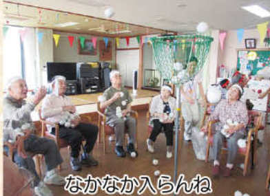
なかなか入らんね