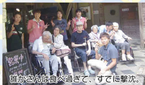
誰かさんは食べ過ぎて、すでに撃沈。