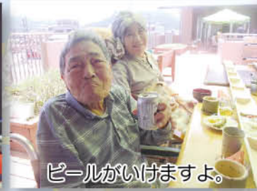
ビールがいただけますよ。