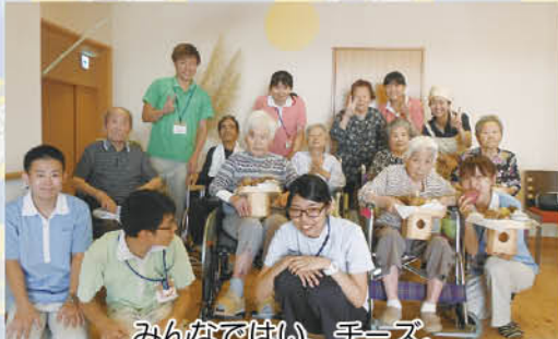
みんなではい、チーズ。