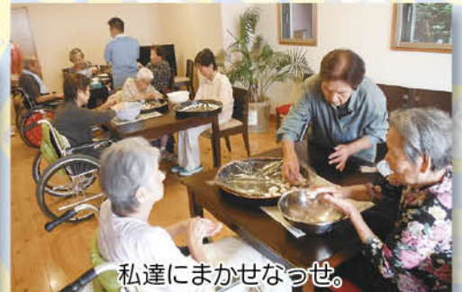
私達にまかせなっせ。