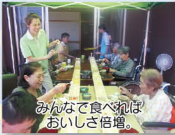
みんなで食べれば おいしさ倍増。