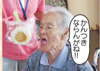
かんつき ならんがね!!