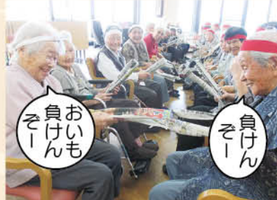
おいも 負けんぞー