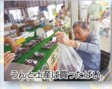
うんと土産は買ったばい。