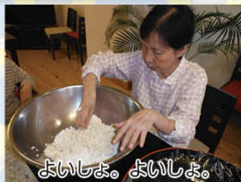
よいしょ。よいしょ。