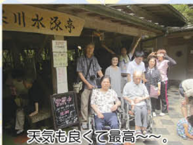
天気も良くて最高〜。